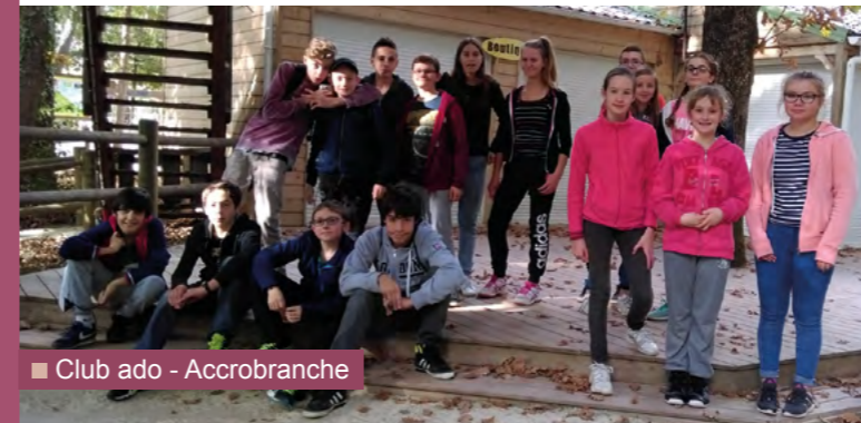
■ Club ado - Accrobranche

Conseiller municipal en charge des nouvelles technologies et des relations extérieures