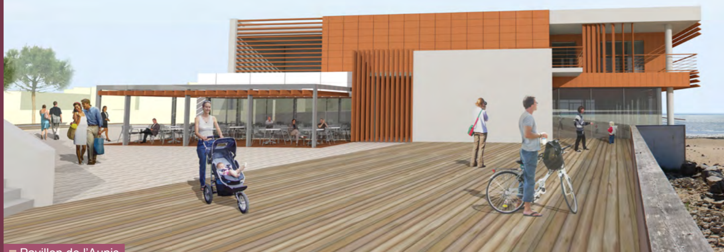
■ Pavillon de l'Aunis