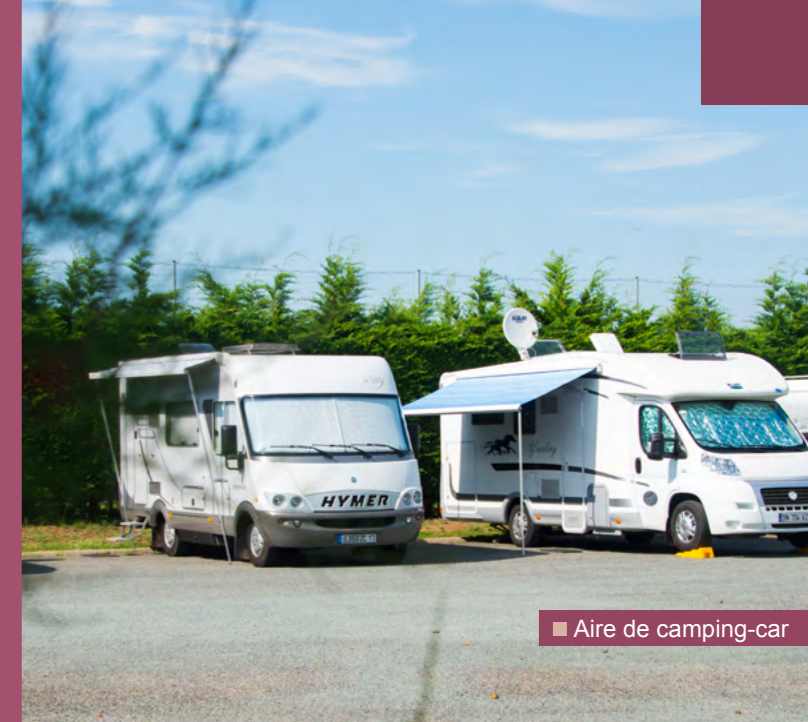
■ Aire de camping-car

Enfin, les abords seront réorganisés en un ensemble cohérent avec un vaste espace piéton entre le Pavillon de l'Aunis et l'actuelle Maison forestière.