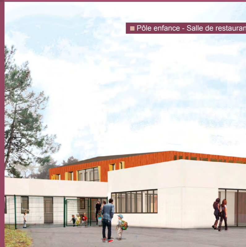
■ Pôle enfance - Salle de restaurant

La surface au sol sera un mélange de terre, pierre et herbe (plutôt qu'un enrobé) afin de s'inscrire pleinement dans une démarche éco-touristique.