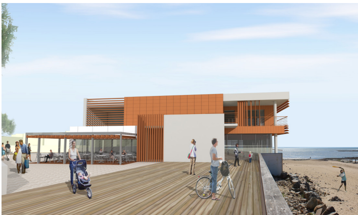
Vue de l'esplanade qui accueillera la terrasse du restaurant

Pour les aménagements extérieurs, les travaux suivant seront réalisés avant l'été : réalisation d'une esplanade qui accueillera la terrasse du restaurant du pavillon ainsi que des animations l'été et aménagement (aux normes PMR) d'une rampe d'accès entre l'esplanade et le parking Capitaine Bigot. Le nouveau Pavillon de l'Aunis sera inauguré pour la saison d'été 2017.