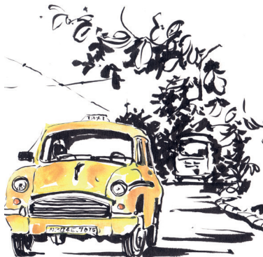
Artiste : Odile Santi

Vente d'objets rapportés des voyages au profit de l'association Sumati Balvan qui œuvre pour les écoles indiennes