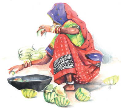
Artiste : Odile Santi