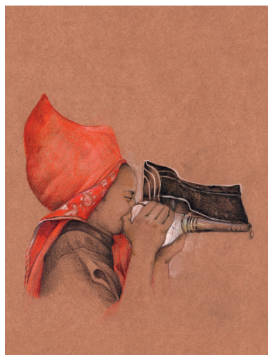
Artiste : Odile Santi