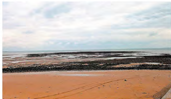
L'estran rocheux de la commune de La Tranche-sur-Mer.

dunaire de La Terrière La stabilisation des dunes est essentielle dans la lutte contre l'érosion. Au total, 378 kilomètres de dunes domaniales le long de la façade atlantique sont actuellement sous la responsabilité de l'Office national des forêts (ONF). La maîtrise du déplacement des dunes, la surveillance, le suivi de l'évolution des cordons dunaires et des écosystèmes dunaires sont les principaux objectifs de la mission d'intérêt général confiée à l'organisme par l'État. Ils tiennent compte de la biodiversité, des paysages et de la fréquentation touristique sans remise en cause des équilibres naturels. Dans le cadre de la fête de la mer et des littoraux, La Tranche-sur-Mer propose aujourd'hui, à 10 h, une visite gratuite guidée par un agent de l'ONF de la dune de La Terrière. Le rendez-vous est fixé au parking de la plage de la Terrière.