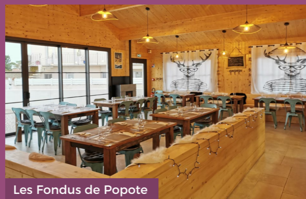
Les Fondus de Popote

Jean-Claude Escalbert - 3 e adjoint en charge de la voirie, des bâtiments communaux et du camping municipal.