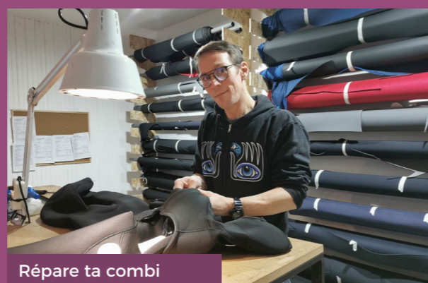
Répare ta combi