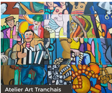
Atelier Art Tranchais